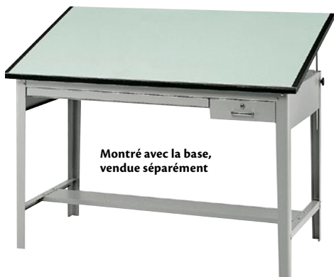
Montré avec la base, vendue séparément